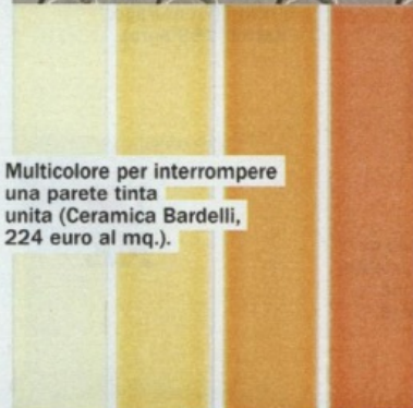
Multicolore per interrompere una parete tinta unita (Ceramica Bardelli, 224 euro al mq.).