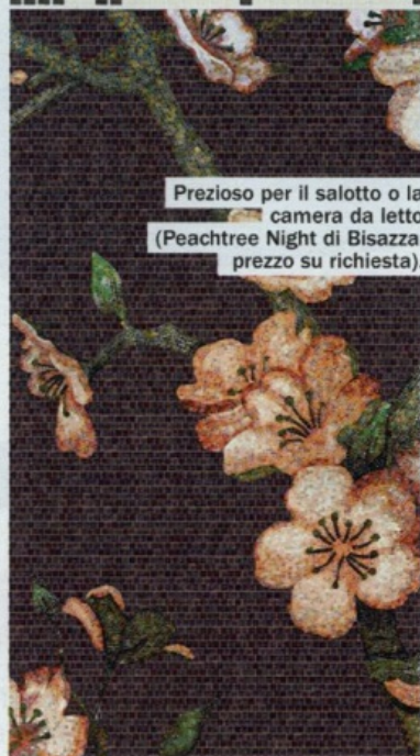
Prezioso per il salotto o la camera da letto (Peachtree Night di Bisazza, prezzo su richiesta).