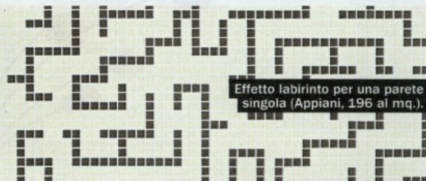
Effetto labirinto per una parete singola (Appiani, 196 al mq.).