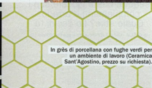
In grès di porcellana con fughe verdi per un ambiente di lavoro (Ceramica Sant'Agostino, prezzo su richiesta).